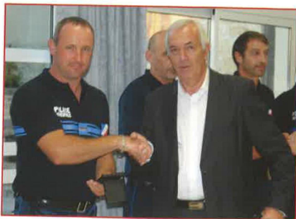
Remise des médailles de la ville par M. Le Maire de Vestric.