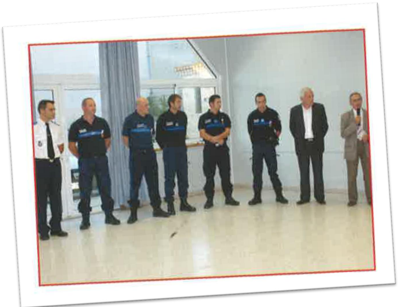
Discours de M. J-Baptiste ESTEVE Président de la communauté de communes