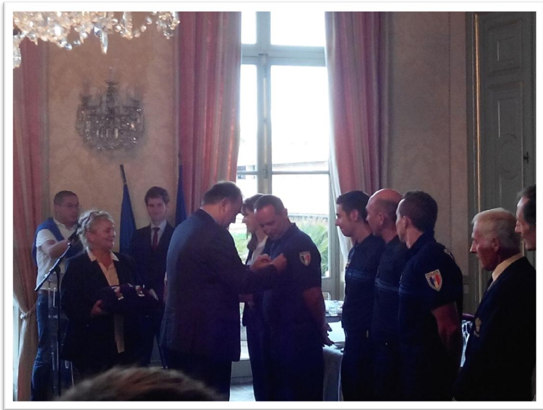
Remise des médailles par M. Le Préfet dans les salons de la Préfecture.